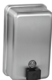
SLZN 39 95390 Nerezový dávkovač tekutého mýdla