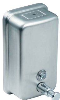
SLZN 05 95050 Nerezový dávkovač tekutého mýdla